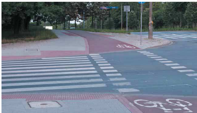
fol. Korneliusz Grabka