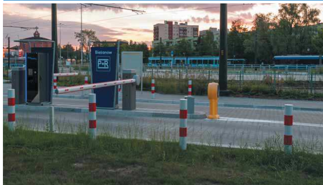
fol. Korneliusz Grabka