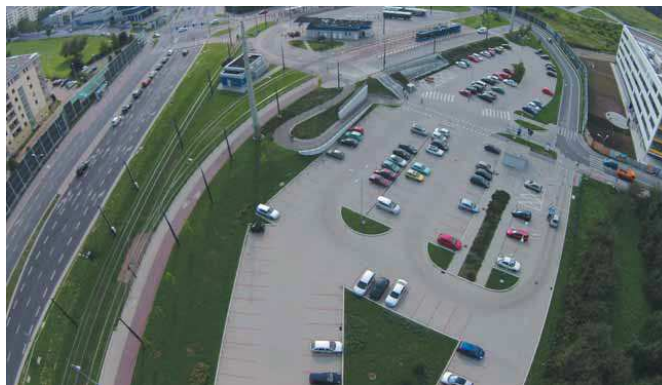
fol. Piotr Hamarnik ZIKIT