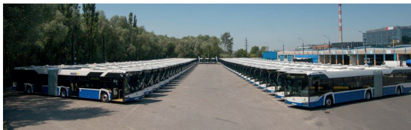
Nowoczesny tabor komunikacji zbiorowej w Krakowie.

cy Krakowa z gminami ościennymi oraz wspólne stworzenie Strategii rozwoju dla tego obszaru, zawierającej konkretne inwestycje mające źródło finansowania ze środków wydzielonych dla ZIT. Trzeba podkreślić, że podejście takie można traktować jako oddolne działania służące tworzeniu obszaru metropolitarne go i stanowiące podstawę ścisłej współpracy w zapewnianiu mieszkańcom usług publicznych na najwyższym poziomie.