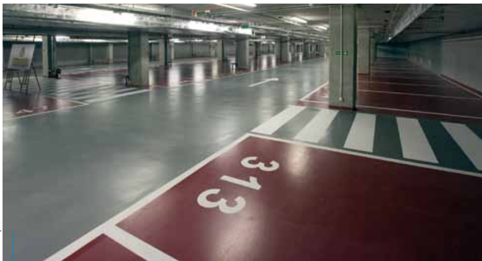
W parkingu podziemnym przy Muzeum Narodowym znajdzie się miejsce dla 150 aut