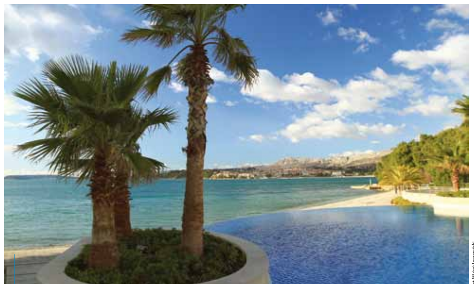
Dla Polaków Chorwacja jest lubianym, a równocześnie najbliższym śródziemnomorskim krajem

Od 1975 r. Kraków jest miastem partnerskim Zagrzebia. Obydwa miasta wspólnie zrealizowały wiele interesujących projektów kulturalnych i promocji turystycznych.