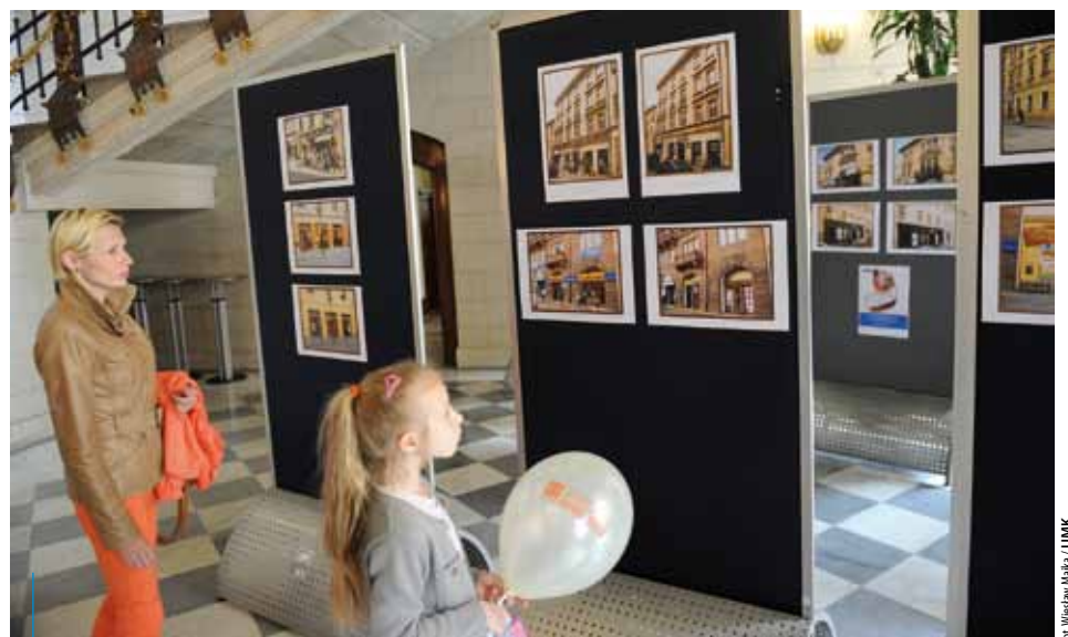
Wystawę fotograficzną pn. „Park Kulturowy – jak zmieniło się Stare Miasto” można było oglądać podczas Święta Miasta w krakowskim magistracie

Oczywiście kształtowanie krajobrazu oraz przestrzeni publicznej, w której żyjemy, to problem bardzo skomplikowany. Jeśli zaczniemy rozdzielać odpowiedzialność za to, co się z tą przestrzenią dzieje, na pojedyncze elementy – czy to samorząd, władze państwowe, organizacje, stowarzyszenia czy wreszcie samych mieszkańców, może się okazać że samodzielnie mają one ograniczone możliwości działania. Ale jeśli potraktuje się wszystkich jako równorzędnych partnerów współdziałających i współodpowiedzialnych za to, co dzieje się wokół, to okazuje się, że wiele można zrobić i zmienić. Utworzenie Parku Kulturowego Stare Miasto w Krakowie jest przykładem takich właśnie wspólnych działań.