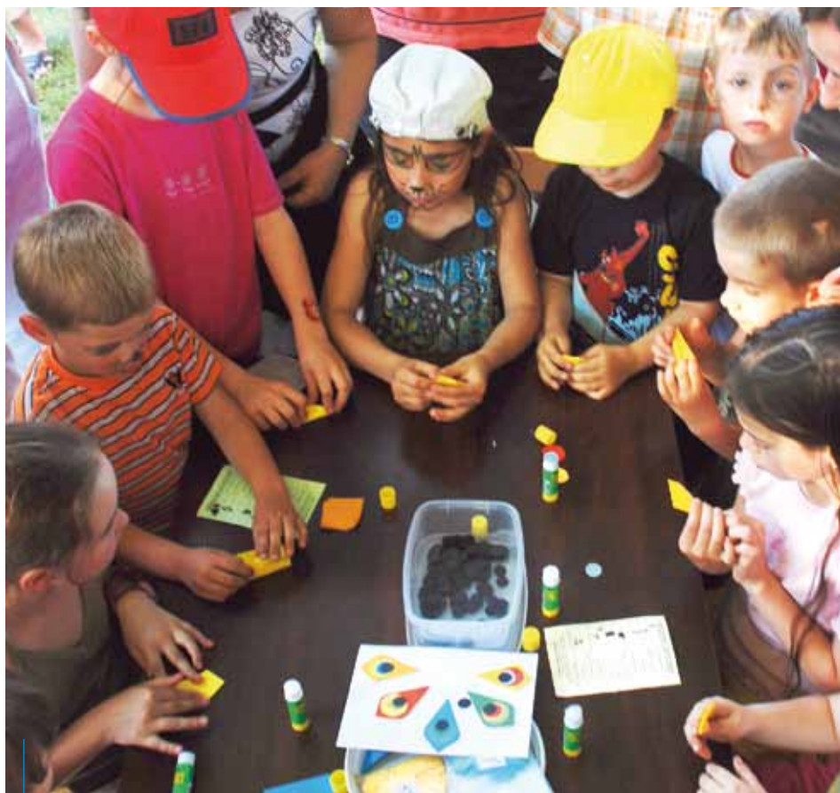
Wakacje w Dworku Białopądnickim zapowiadają się naprawdę interesująco

Dla dzieci objętych Programem „Krakowska Karta Rodzinna 4+” przygotowano wiele atrakcji, m.in. bezpłatne wejściówki na krakowskie baseny – KS Wanda (lipiec), OSiR Kolna (sierpień). W ramach programu Bezpieczny Kraków w Parku Wodnym codziennie po okazaniu karty KKR4+, będzie można nabyć 30 biletów w promocyjnej cenie. Dla dzieci i młodzieży przygotowano także cykl zajęć „Umiem Pływać” na basenach Com-Com Zone (ul. Ptaszyckiego i ul. Kurczaba) oraz w OSiR Kolna. Szczegółowe informacje dotyczące oferty na stronach: www.kkr.krakow.pl oraz www.bip.krakow.pl .