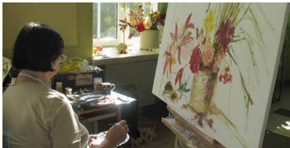
Przychodząc do dziennego domu pomocy społecznej, można wziąć udział np. w zajęciach plastycznych