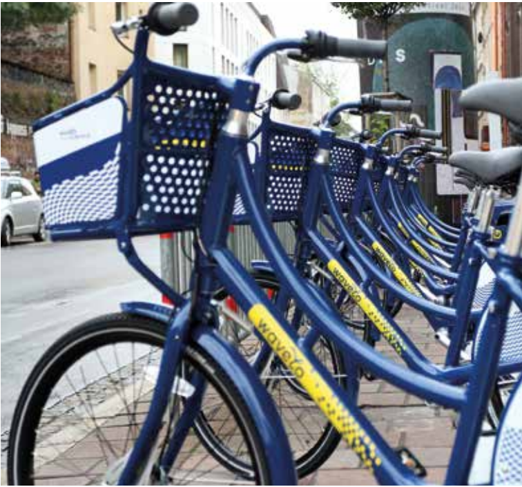
100 jednośladów oraz 15 stacji – krakowianie mogą korzystać z pierwszej pilotażowej partii rowerów „Wavelo”