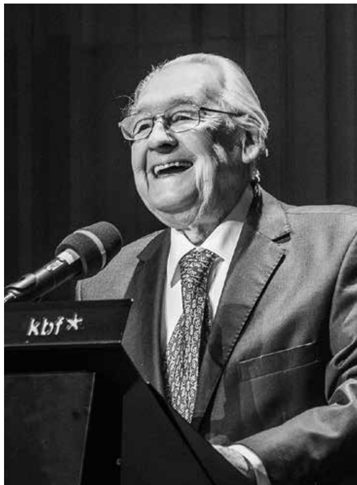
Andrzej Wajda (1926–2016)

Wraz z Nim utraciliśmy ważną cząstkę naszego życia...”