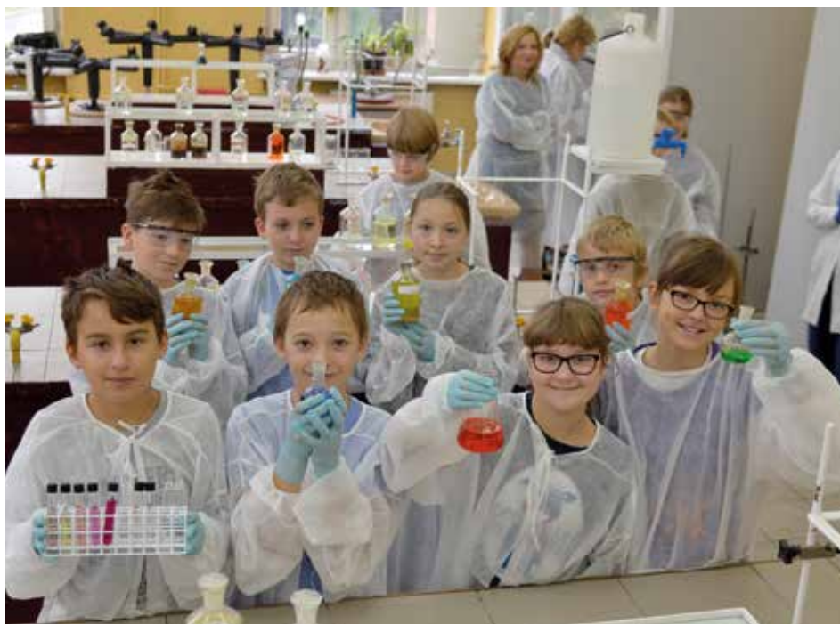
Uczniowie Zespołu Szkół Chemicznych przygotowali dla najmłodszych zajęcia ekologiczne w formie zabawy

scenariusze działań na rzecz ekologii. Dodatkową atrakcją dla maluchów była możliwość przeprowadzenia minidoświadczeń chemicznych, m.in. stworzenia chemicznego wulkanu. W ramach projektu dla uczniów ze szkół