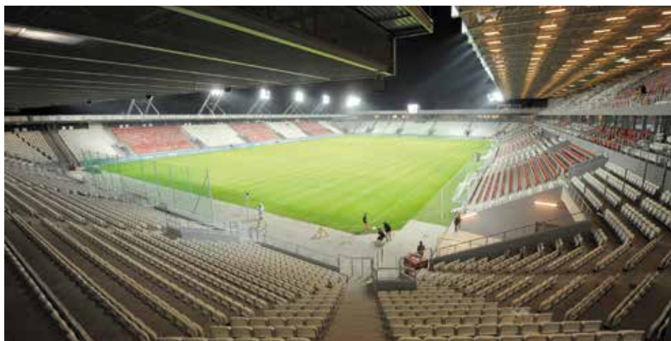
Mecze przyszłorocznych Młodzieżowych Mistrzostw Europy w Piłce Nożnej rozgrywane będą na stadionie miejskim przy ul. Kałuży

Wiele też wskazuje na to, że stadion miejski, na którym swoje mecze ekstraklasowe rozgrywają piłkarze Cracovii, przejdzie w listopadzie kolejny test przed EURO U-21. Tym razem meczowy, gdyż 10 listopada zagra na nim młodzieżowa reprezentacja Polski, przygotowująca się do przyszłorocznego turnieju.