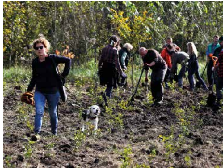
Jesienne zalesianie w Toniach