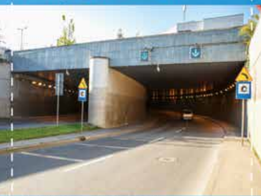
Tunel KCK im. św. Rafała Kalinowskiego