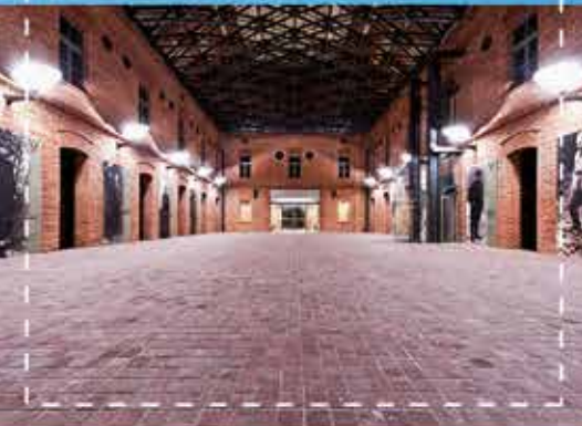
Muzeum Armii Krajowej