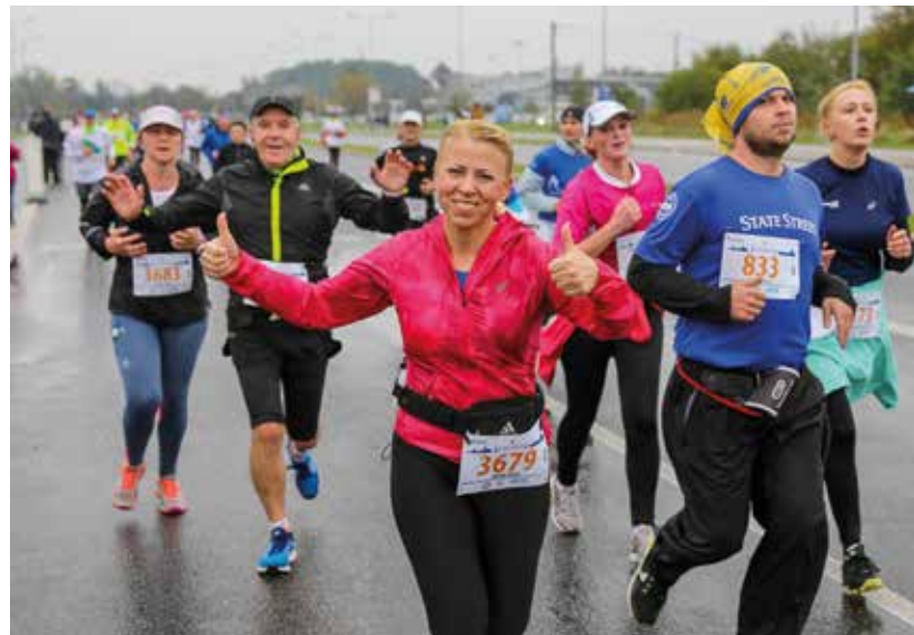
III Królewski Półmaraton ukończyło 7079 zawodników!